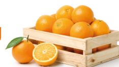
Formato holandés 10 kg