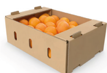
Kraft 15 kg