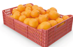
Plancheta 10 kg